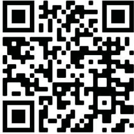
Ein Klick zum Video Pflanzenbaujahr

AGROLINE lancierte letzten Dezember den Baustein AGROLINE Service. Dieser Baustein ermöglicht dir, deinen eigenen digitalen Pflanzenschutzplan zu erstellen und eine Bestellliste an deine LANDI zu senden. Dieser Baustein ist Teil vom Pflanzenbaujahr von barto. Wir zeigen dir, was der digitale Hofmanager von barto mit seinem Feldkalender zudem kann.