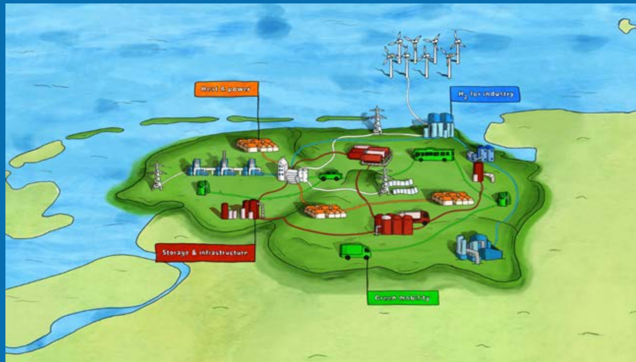
Afbeelding: de Noord-Nederlandse waterstofketen van HEAVENN