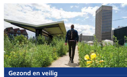
Gezond en veilig