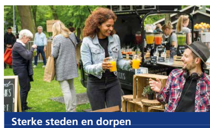
Sterke steden en dorpen