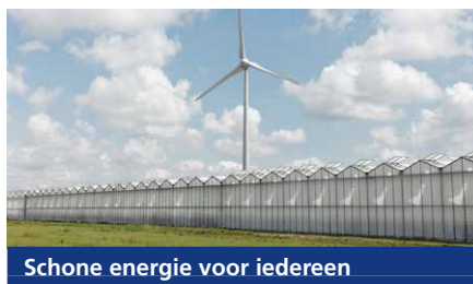
Schone energie voor iedereen